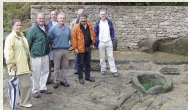
Les élus de la communauté de communes se sont rendus à Haute-Faye pour inaugurer, avec les représentants de la commune et de l'ASEPPV, le complexe hydraulique restauré.

La restauration de l'ensemble hydraulique de Haute-Faye est achevée. C'est le fruit d'une démarche partenariale exemplaire entre la communauté de communes de Bourgageuf – Royère de Vassivière, la commune de Royère de Vassivière et l'Association de Sauvegarde et d'Entretien du Patrimoine du Pays de Vassivière (ASEPPV). Réalisés par l'entreprise SOCOBAT de Bourgageuf, les travaux sont à la hauteur des espérances de l'association et des