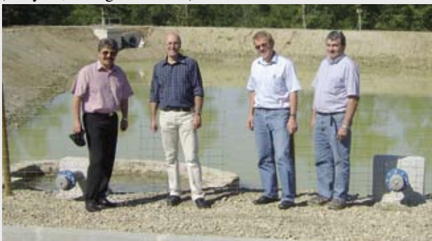
Réception des travaux à Langladure.

Pour se prémunir du risque incendie, la communauté de communes a donc équipé d'installations performantes, testées par les sapeurs-pompiers, toutes les zones d'activités économiques, les nouvelles de Rigour-Nord, Langladure et Royère de Vassivière mais aussi la plus ancienne, celle de La Chasagne (Cosylva, Bourgneuf Bois) avec une réserve d'eau de 900 m 3 .