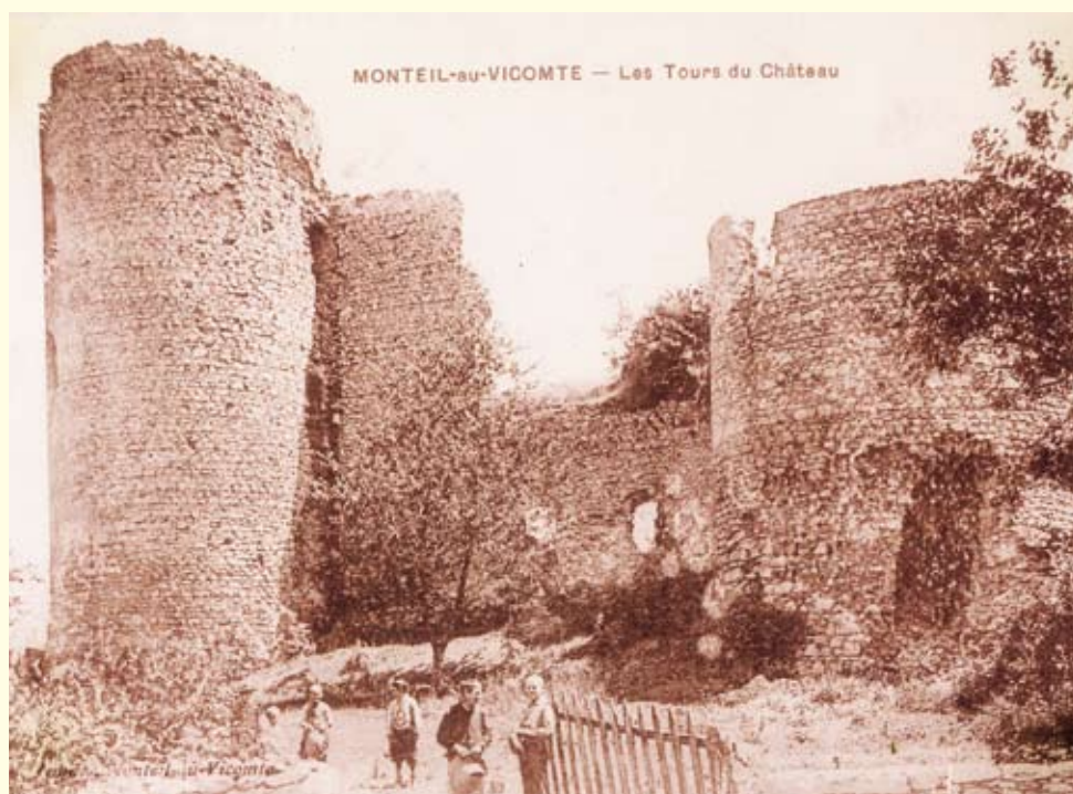
Le château avec ses deux tours au début du XX e siècle (Collection de la commune du Monteil-au-Vicomte).

Crédit photos : communauté de communes, ERELIS, Guilhem Carbon et GBL