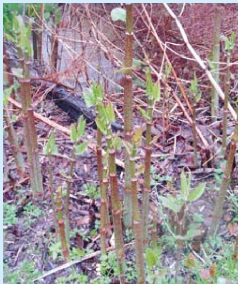
Une espèce invasive : La Renouée du Japon.

La démarche n'est donc pas nouvelle mais cette fois les enjeux du Contrat Restauration Entretien (CRE) sont beaucoup plus ambitieux. Ils s'inscrivent dans le développement durable car au-delà des interventions physiques, ils répondent aux impératifs écologiques de notre époque et à la nécessaire pérennisation de la biodiversité. Il s'agit donc de préserver, restaurer et diversifier les écosystèmes aquatiques; de veiller à la bonne gestion qualitative et quantitative des eaux; de préserver le patrimoine paysager et l'héritage culturel; de maintenir les espèces vivantes (faune et flore) et enfin, de concilier les divers usages de l'eau. Tout cela nécessite une prise de conscience collective qui passe par une information et une sensibilisation du public. Cette démarche en faveur des usagers ne peut se faire qu'avec eux.