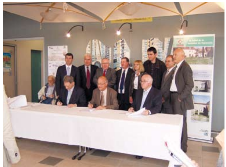
Le don du Crédit Coopératif.