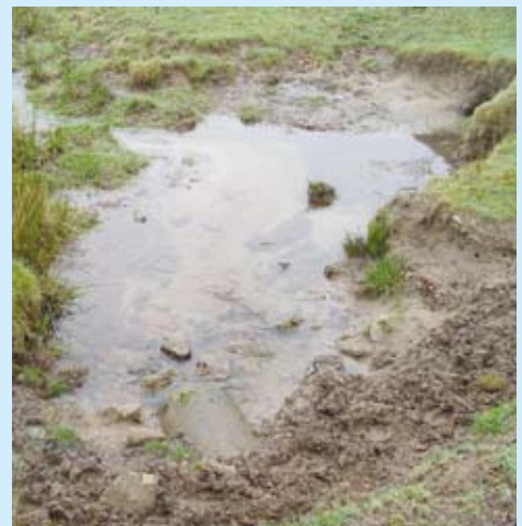
Le piétinement des berges par le bétail (La Leyrenne).

Le programme d'actions sera subventionné par l'Agence de l'Eau Loire-Bretagne, La Région Limousin et le Département.