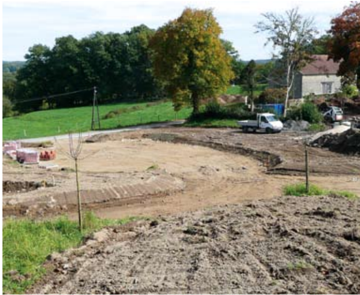
Le chantier de la Martinèche.

Depuis avril 2008, la Martinèche est une véritable ruche. Tous les corps de métiers s'affairent pour que ce site devienne un espace de mémoire, de visite et d'animation autour du personnage de Martin Nadaud. A l'été 2009 les travaux de restauration des bâtiments et les équipements muséographiques, qui constituent la première tranche du projet, seront achevés. Déjà le gros œuvre est terminé. Il faut maintenant réaliser les travaux intérieurs (cloisons, sols, électricité), aménager le jardin