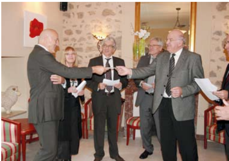
La remise du chèque des fédérations du Bâtiment.

Les chèques doivent être libellés à l'ordre de « Fondation du Patrimoine-Martin Nadaud » et accompagnés du bulletin de don. Chaque don ouvre droit à des avantages fiscaux : 60 % de crédit d'impôt pour les entreprises dans la limite de 5 % du CA ; réduction d'impôt de 66 % du don pour les particuliers, dans la limite de 20 % du revenu imposable.