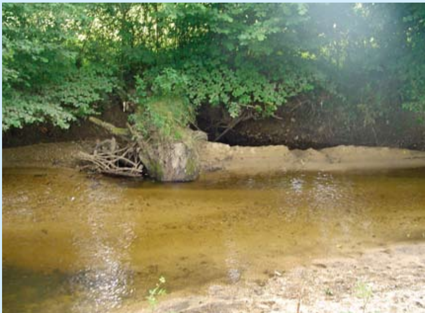
Le lit du Thaurion ensablé.

Au terme de ce dialogue avec l'ensemble des partenaires et des usagers de l'eau, la communauté de communes de Bourgneuf-Royère de Vassivière signera le contrat avec l'Agence