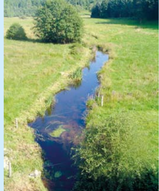
Absence de boisement sur les berges du ruisseau du Verger.

Pour résoudre ces problèmes, la communauté de communes va agir, avec ses différents partenaires et en concertation avec les proprié- taires,