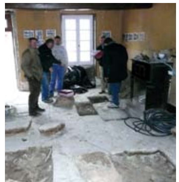
Les travaux intérieurs sont en cours.