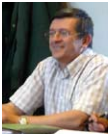
Hervé GUILLAUMOT Vice-président Politique de l'habitat, maîtrise de l'énergie, énergies renouvelables