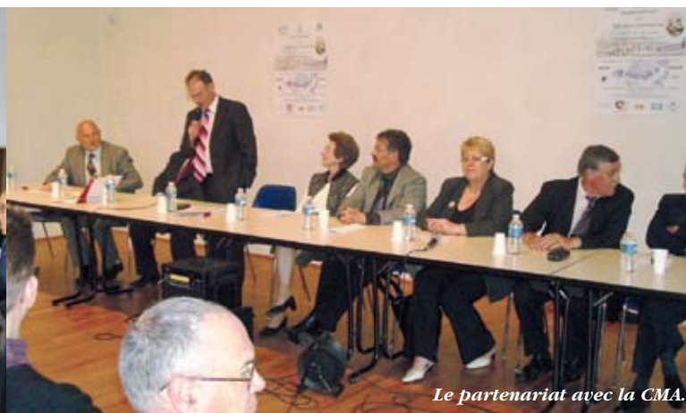
Le partenariat avec la CMA.