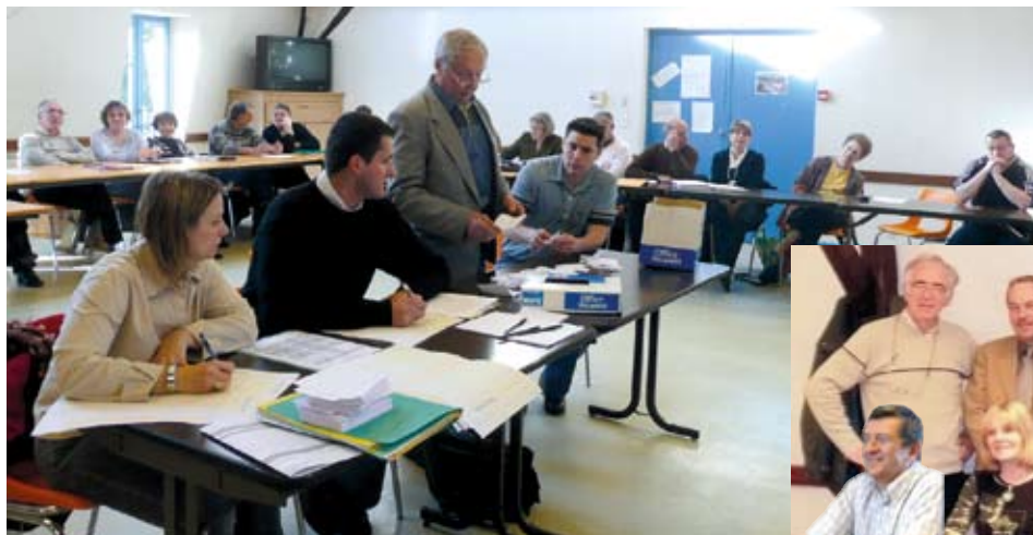
Le dépouillement du scrutin du conseil communautaire.