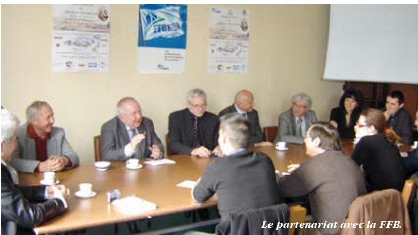
Le partenariat avec la FFB.