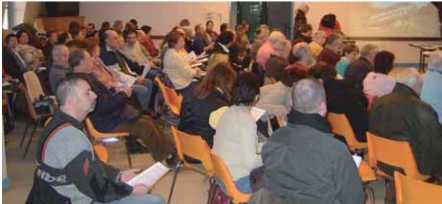
Lors de l'assemblée constituante de l'OTI.

Créé à la suite d'une large concertation